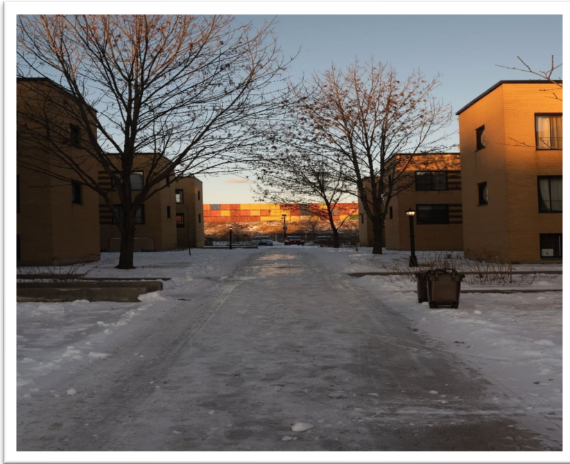
Photo de la coopérative d’habitation Le petit train de Viauville