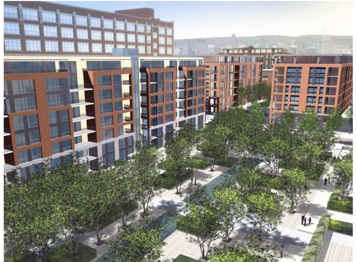
Vue de la cour intérieure de l'îlot B