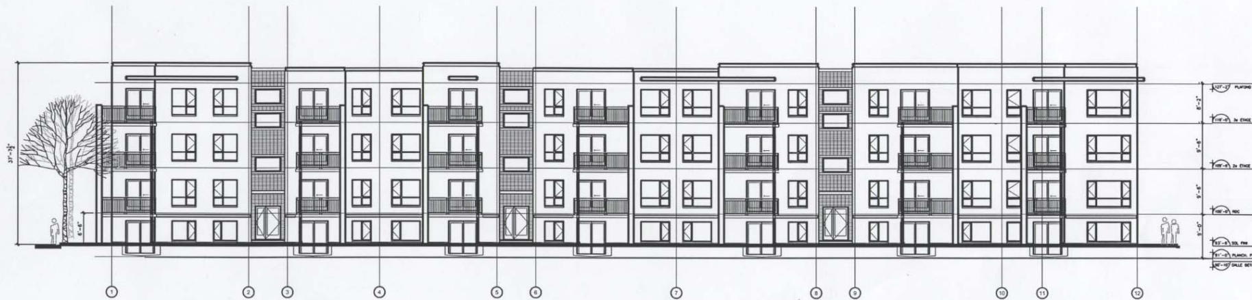
ÉLÉVATION BÂTIMENT-A RUE JOLIETTE